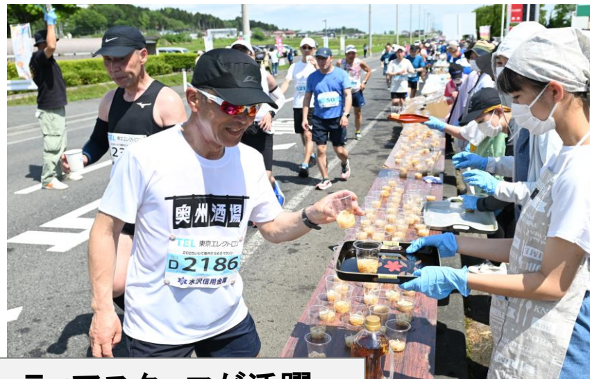
市内各所で応援・ボランティアスタッフが活躍